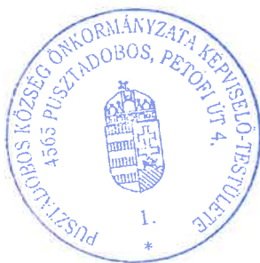
Dani Attila polgármester